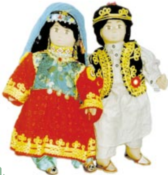
KUCHI - Nr.3