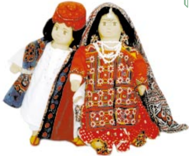
Nr.2 - SINDHI