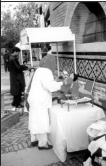
Verkaufsstand während des Festivals

13. - 23. November 1997, Lahore Alhamra Cultural Complex, Ferozpur Road, Lahore