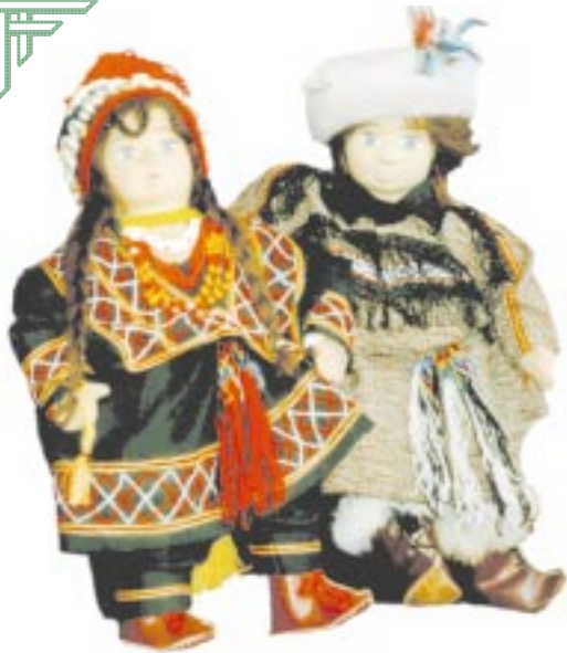
KALASHI - Nr.1