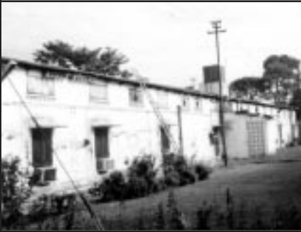
Das Flashman in Rawalpindi

Pakistan Tourism Development Corporation Ltd. vermarktet nun diese Objekte; für die einen verlorene Vergangenheit, eher noch ein Teil Bau- und Literaturgeschichte,- für die anderen Zeichen des sozialen Aufstiegs, schließlich feiert man heute dort; bezogen auf die internationalen 5-Sterne Hotels indiskutabel.