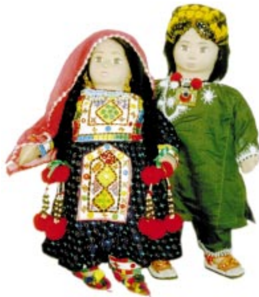
Nr.4 - BALUCHI